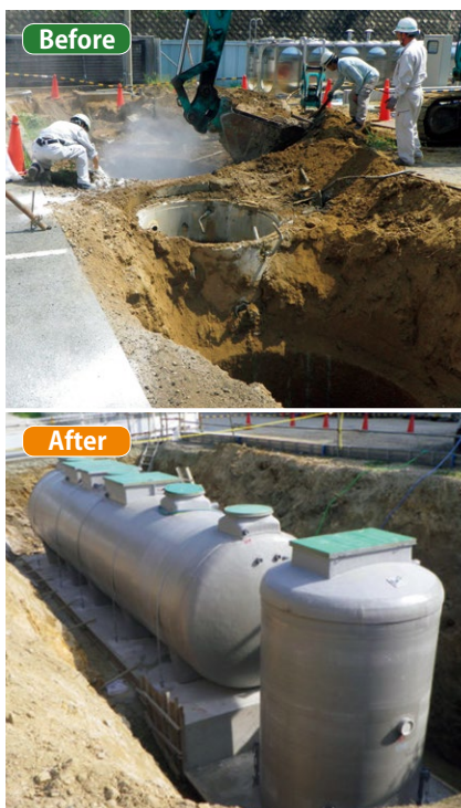
▲大型浄化槽の本体交換工事風景 (上)既設浄化槽の撤去(下)新設浄化槽の設置

大型浄化槽の転換には、綿密な現地調査により既存の配管や電気系統などの位置を正しく判断し、最適な施工を施す経験と知識が必要。施工にあたっては、既存浄化槽の廃止届、新設浄化槽の設置届、特定施設の排水処理計画書(特定施設に該当する場合)、放流同意書などの作成、提出が求められる。 101人槽以上の浄化槽の転換工事の費用は、1本管