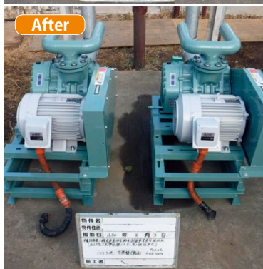
▲ばっ気ブロワ交換事例(上)交換前(下)交換後