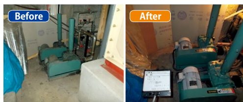
▲交換したばっ気プロワ(左)交換前(右)交換後