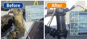
◀交換した中継ポンプ(左)交換前(右)交換後

導入から10年が経過した屋外設置プロワだけでなく、ポンプ及び周辺機器の交換時期も迫っていたため、補助金の申請を提案。その結果、交換が必要とされる全ての機器において、補助金が交付された。