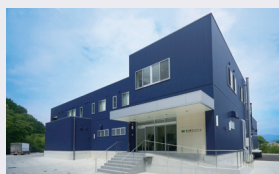
▲鮮やかなブルーが特徴の新工場